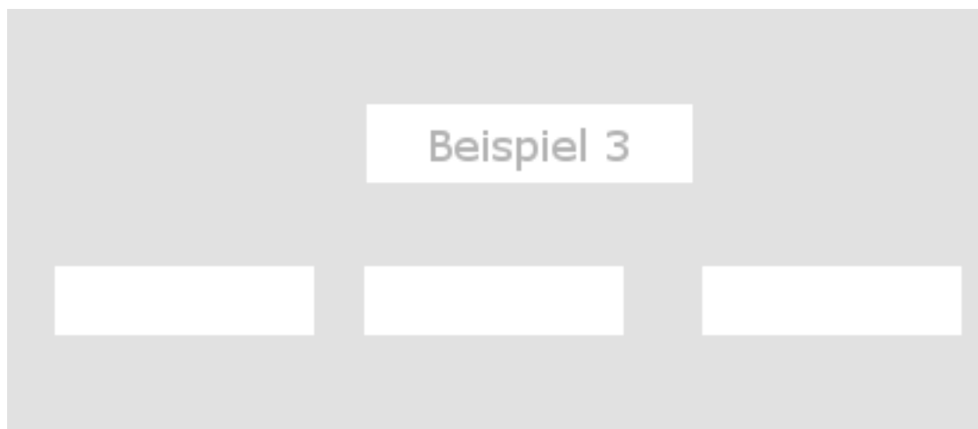
Abbildung 3.1: Beispiel 3 zum Einfügen einer Grafik

hendrerit quis, nisi. Curabitur ligula sapien, tincidunt non, euismod vitae, posuere imperdiet, leo. Maecenas malesuada.