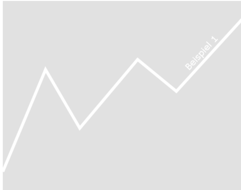
Figure 1.1: Example 1 for inserting an image

vestibulum mollis diam. Pellentesque ut neque. Pellentesque habitant morbi tristique senectus et netus et malesuada fames ac turpis egestas. In dui magna, posuere eget, vestibulum et, tempor auctor, justo.