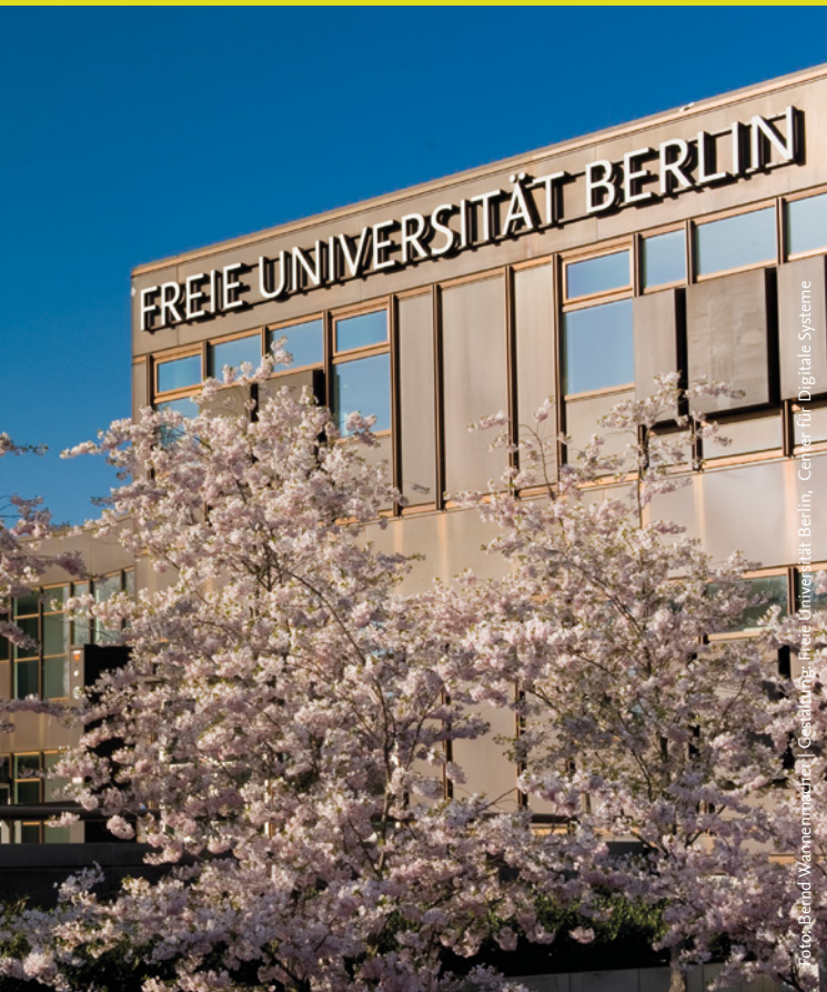
Gestaltung: Freie Universität Berlin, Center für Digitale Systeme